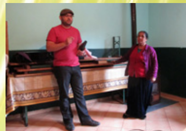
阿爾巴尼亞 Elbasan 市羅姆人教會負責同工邀請羅姆人姊妹分享